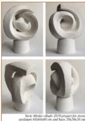
Yuriy Mysko «Bud» 2019 project for stone sculpture 80x80x60 cm and base 20x10x20 cm

Né à Lviv en Ukraine, Yuriy va obtenir ses diplômes à l'académie des Beaux-Arts de la ville avant d'y donner des cours de sculpture pendant plus de 20 ans. Il expose et participe à de nombreux symposiums en Ukraine et en Europe de l'Est essentiellement. Ses déplacements en France se font rares et le 8ème symposium de Laragne sera une occasion unique de l'observer à l'œuvre.